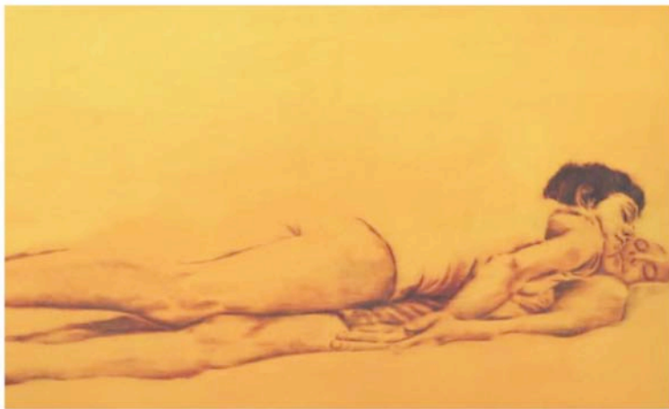
"Zusammen (2016)" von Dieter Mammel. Quelle: Dieter Mammel

In Dieter Mammels Tuschemalerei formen Licht- und Schatten die Bildkörper. Der grafische Charakter der Linie entsteht sogleich im Nass der fließenden Farbe. Was aus der Ferne eindeutig wirkt, löst sich im Herantreten auf – Figuren und ihre Konturen verschwimmen in abstrakter Unbestimmtheit. Hier ist Raum für individuelle Deutungs- und Interpretationsmöglichkeiten. Häufig befinden sich seine Figuren in einem Schwebestadium – zwischen Traum und Wirklichkeit, Lachen und Weinen, Leben und Tod. Sie erinnern an eigene Ängste und Sehnsüchte.